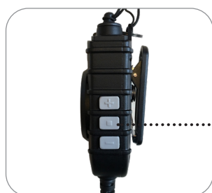
Lautstärkeregler +/- und Stummtaste (optional für Lautsprecher oder Mikrofon)

ist eine sehr vielseitige Zubehörlösung. Mit den handschuhtauglichen Tasten und der Schutzklasse IP67 eignet es sich ideal für den harten Einsatz bei Behörden oder in der Industrie. Mit seiner Nexus-Klinkenbuchse ist es für eine Vielzahl von Audiozubehör geeignet.