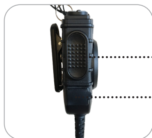
seitliche PTT-Taste 3,5 mm Klinkenbuchse zum Anschluss von Ohrhörern